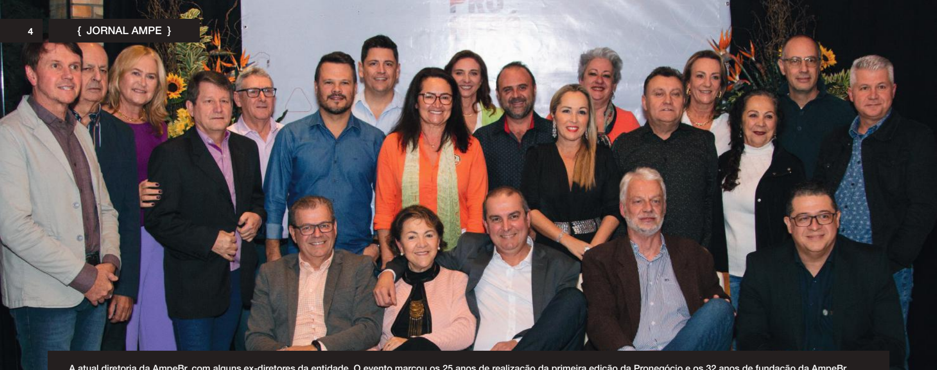
A atual diretoria da AmpeBr, com alguns ex-diretores da entidade. O evento marcou os 25 anos de realização da primeira edição da Pronegócio e os 32 anos de fundação da AmpeBr