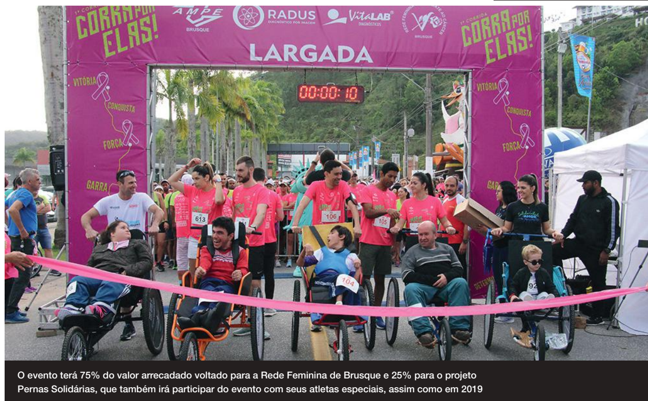
O evento terá 75% do valor arrecadado voltado para a Rede Feminina de Brusque e 25% para o projeto Pernas Solidárias, que também irá participar do evento com seus atletas especiais, assim como em 2019

A premiação do 2º Corra Por Elas será para os cinco primeiros colocados na categoria geral (5km e 10km), tanto masculino como feminino, com troféus. Da mesma forma, serão premiados os