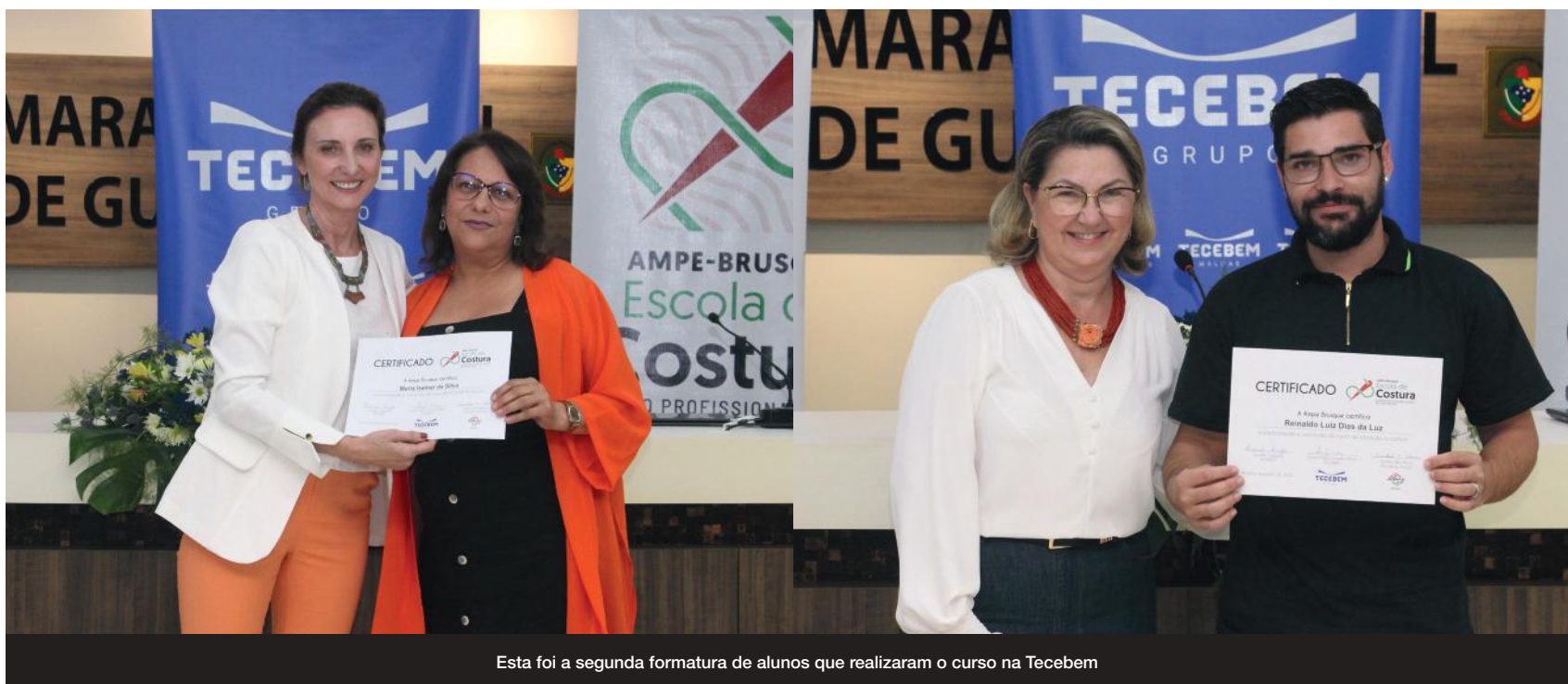
Esta foi a segunda formatura de alunos que realizaram o curso na Tecebem

de, em todos os segmentos. Acreditamos que o trabalho é o que gera desenvolvimento e bem-estar das pessoas. Por isso patrocinamos esse projeto, que aprimora o conhecimento de quem deseja atuar nessa área. Não conseguimos contratar todos os que se formam para atuar na empresa, mas mesmo assim quem participa sai capacitado para atuar no setor e em outros locais”, detalhou Imhof.